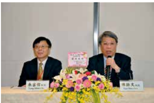
各大醫院腎臟專科權威擔任主持人