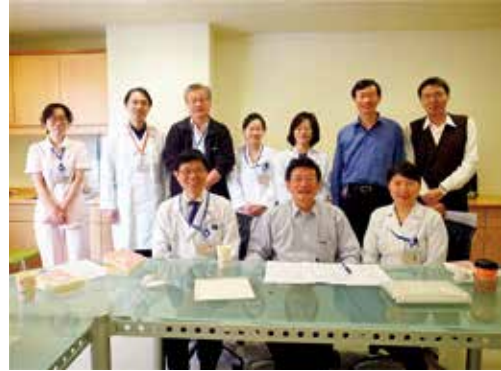
台灣多囊腎多專科團隊