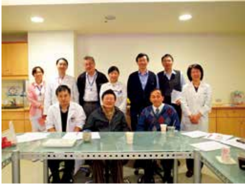
台灣多囊腎多專科團隊