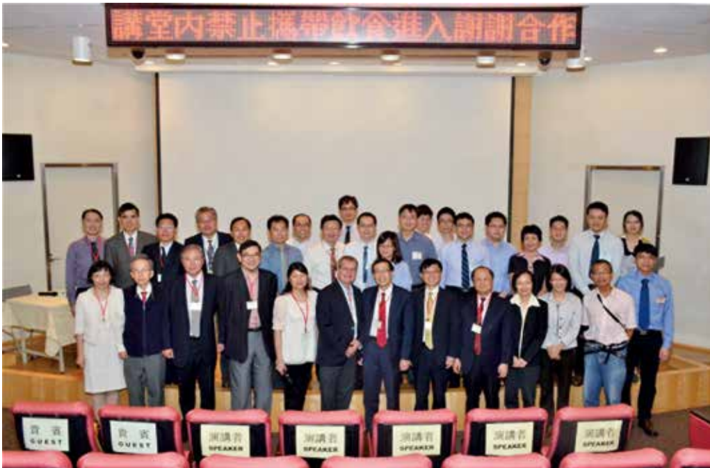
主辦單位及研討會講員與主持人