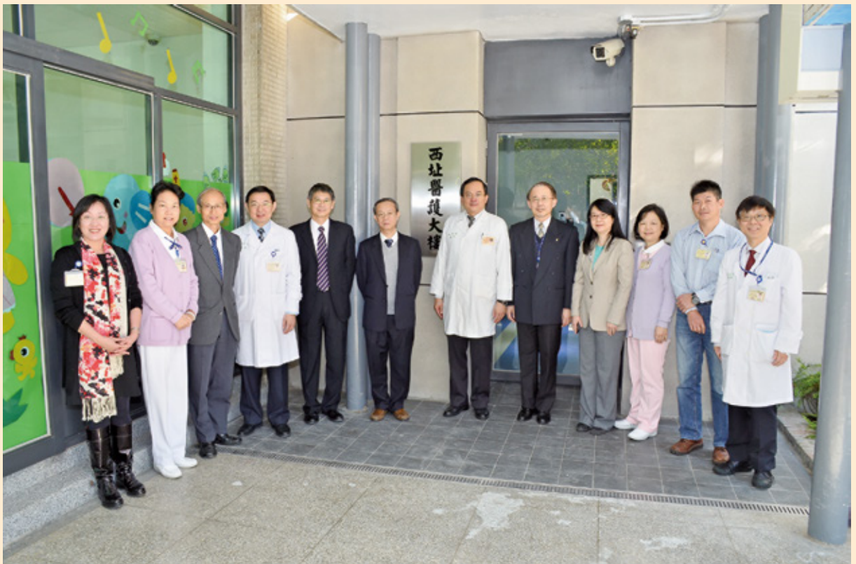
臺大醫院西址醫護大樓正式啟用揭牌儀式