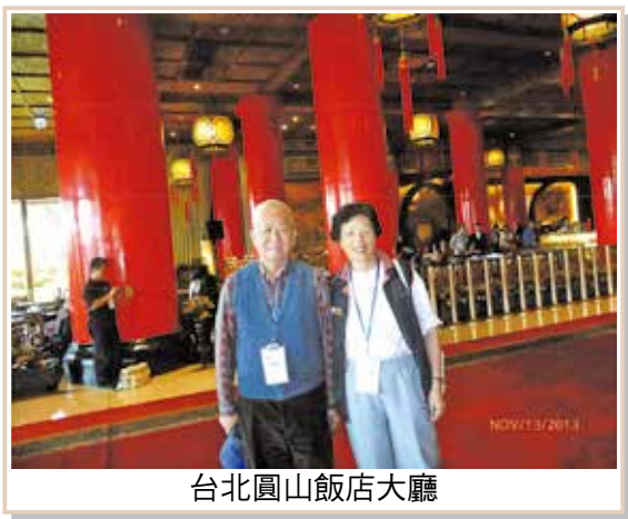
台北圓山飯店大廳

士林官邸佔地遼闊，入口處有圓型大立菊花。上面長滿了一千多朵小而鮮艷的黃菊花，園區遍地有美麗的花圃、草地、小湖。