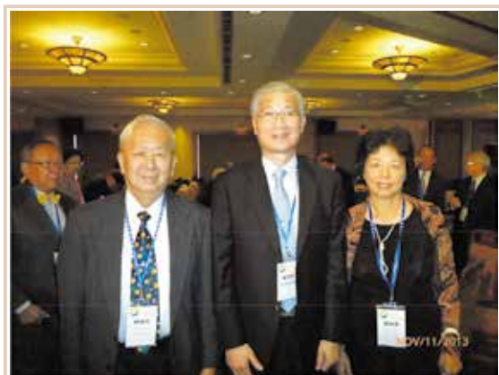
作者夫婦與臺大楊泮池校長合影

主辦人丘宏義的姪女薛麗珍（Nonny Hsueh）是他在台灣的總連絡人兼總指揮。她年輕活躍，辦事能力很強，是這次台北活動的靈魂人物。對於年高老人，尤其是乘坐輪椅，扶拐杖者，照顧得無微不至。在台北共有五場大宴會，11月11日晚宴在一家有名的素菜館蓮花齋自助餐，前副總統呂秀蓮剛好在那裡用餐，她也是臺大校友，因此露面跟大家請安。11月12日午宴在兄弟飯店14樓餐廳舉行，來賓有楊泮池校長，前校長孫震，陳維昭，李嗣涔，前駐美、加大使李大維等人。席間錢煦中央研究院院士做專題演講，並發放臺大校友證，成績單及臺大人回憶錄文集兩大冊。11月13日午餐在101大樓底層的鼎泰豐小籠包，餐後自由參觀101大樓。11月14日午餐在圓山大飯店松鶴廳自助餐，壓軸戲則為11月15日校慶當晚在臺大體育館的千人大宴會。晚宴除了少數演講，則有年輕校友的歌唱跳舞表演、數來寶，和各學系拍照留