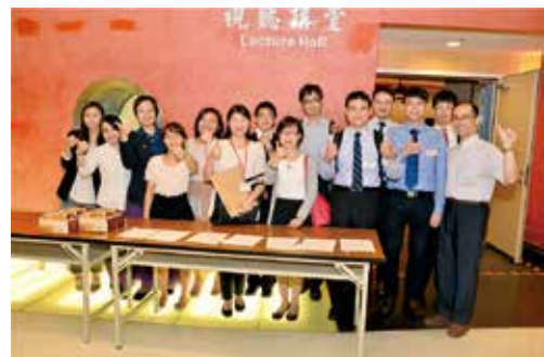
研討會之工作團隊