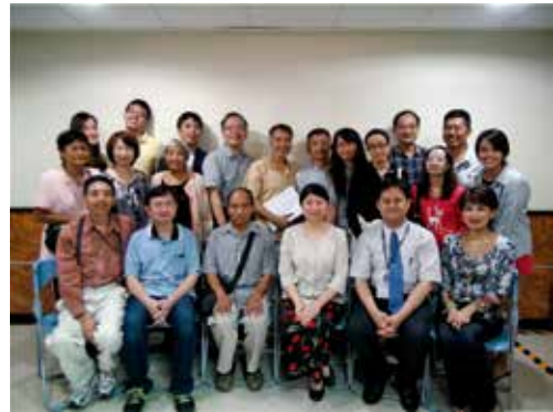
中華民國多囊腎腎友協會

(作者係母校醫學系1994年畢業，母校公共衛生學院職業醫學與工業衛生研究所博士班2012年畢業，現任母校附設醫院內科部腎臟科主治醫師、醫學系臨床助理教授)