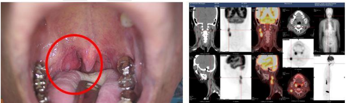
圖一 新診斷右側扁桃腺癌，HPV+ OPSCC，同時合併右側頸部淋巴轉移病患。

希望透過以上的介紹，能讓各位讀者更清楚的瞭解這位頭頸癌的新同學--HPV+OPSCC，勇敢戰勝它。若讀者有疑似相關症狀，也建議找耳鼻喉科專科醫師做詳細檢查，儘早診斷。