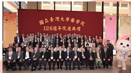
2023年臺大醫學院126週年院慶 暨景福校友返校聯誼活動